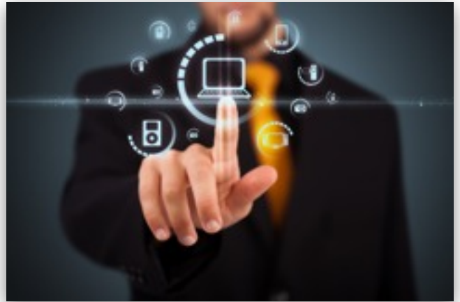
Bild: Webinare, DVDs, Podcasts: Mit dem Trainerportal on demand

So muss der Kunde nicht auf das Gewünschte warten und der Anbieter spart sich eine Menge Administration, Kosten, hat keinen Aufwand für die Rechnungserstellung und auch der Zahlungseingang ist sofort gesichert. Mahnwesen ade!