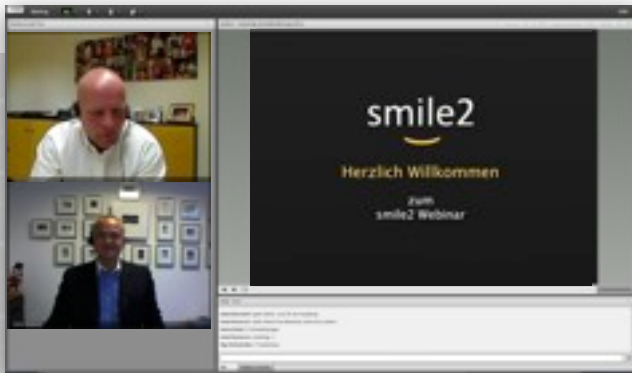
Bild: Webinare für viele Einsatzmöglichkeiten inkludiert

Die nächste Überraschung erlebt der Portalnutzer dann, wenn er zum ersten Mal ein Produkt als Webinar anlegt.