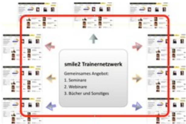
Bild: Vermarktungsgemeinschaften über vernetzte Portale

Der besondere Clou dabei ist, dass jeder Speaker, Trainer, Coach, oder Consultant das System zwar vollkommen autark nutzt, man sich die die eingestellten Produkte aber gegenseitig zur Mitvermarktung frei schalten kann.